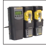
Compatible con MicroDock II