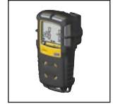
Funda a prueba de golpes

Para obtener la lista completa de accesorios, póngase en contacto con BW Technologies by Honeywell.