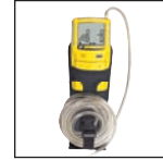
Funda de cinturón